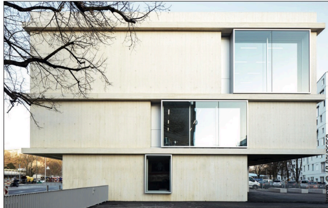
EXTENSION de l'école du Val d'Arve, Carouge.

«A l'origine, en 1993, on choisissait une thématique pour chaque édition», raconte Luciano Zanini. «Du coup, des membres se plaignaient que telle ou telle catégorie d'ouvrage ait été oubliée.» Quand la remise des distinctions a